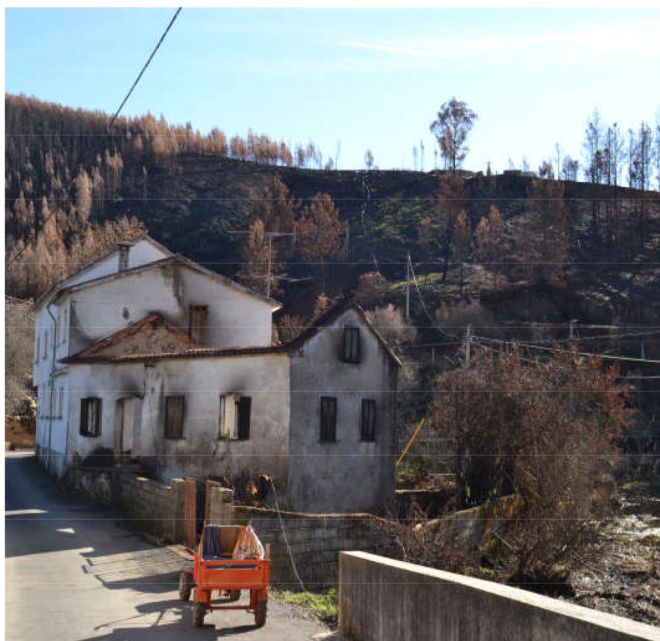
Praçais, Pampilhosa da Serra, Portugal

A ACMG analisou dados climáticos representativos de várias zonas Atlânticas dos últimos 30 a 50 anos. A proximidade ao oceano foi observável com uma média de temperaturas mínimas de 5.5°C em Mullingar (Eire), 8,7°C em Agen (França) e 10°C na Amareleja (Portugal). Um aumento da temperatura média anual foi observável, de +0.3°C em Valência (Eire), +0.7°C no Sudoeste de Devon (Reino Unido), +1.2°C em Agen (França), +0.8°C em Lourian (Galiza, Espanha) e +1.3°C na Amareleja (Portugal). A precipitação não mostrou nenhuma tendência, com zona em Portugal com um aumento de 12.8% e outras na Galiza, Garona e Devon com uma diminuição de 0.5%. A média da amplitude térmica diária varia no Verão de 5.6°C em Valencia (Eire) a 13°C na Amareleja (Portugal) enquanto que em Bergerac (França) esta é de 11.2°C. Esta amplitude está a aumentar em 7 locais (+0.1 to 1°C) e a diminuir em 1 (-0.4°C), enquanto se mantém estável em 2 locais.